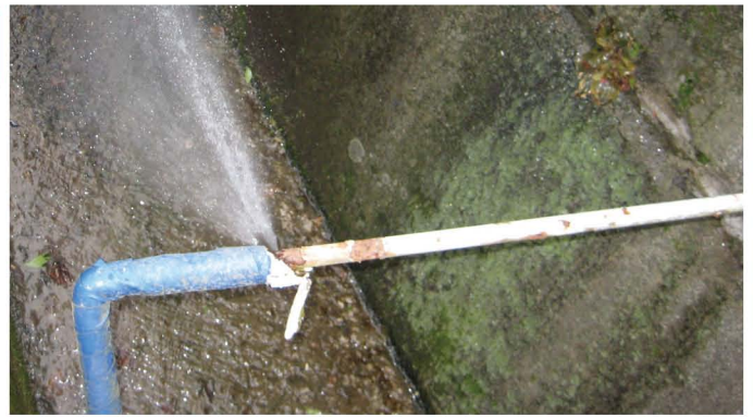
露出配管からの漏水状況