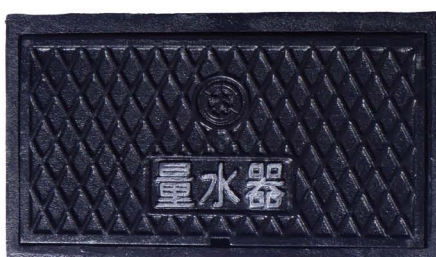
メーターボックス