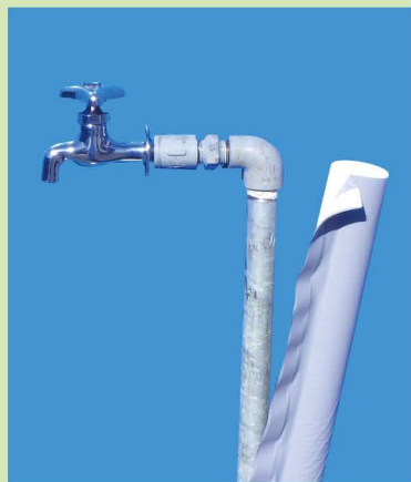
保温材を巻きます